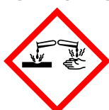
GHS05 Działanie żrące